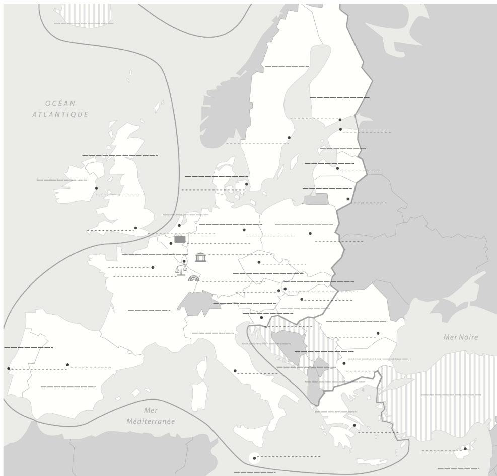
Le cœur politique de l'Europe